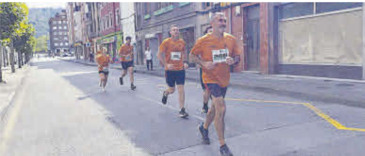
Los corredores, a su paso por Sotrondio.

de empleo del Sepepa, lo que demuestra su compromiso con estas políticas». En agosto, las oficinas de empleo registraron 1.093 personas