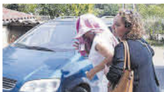
La viuda del ganadero, tapada, y su hermana entran en casa.