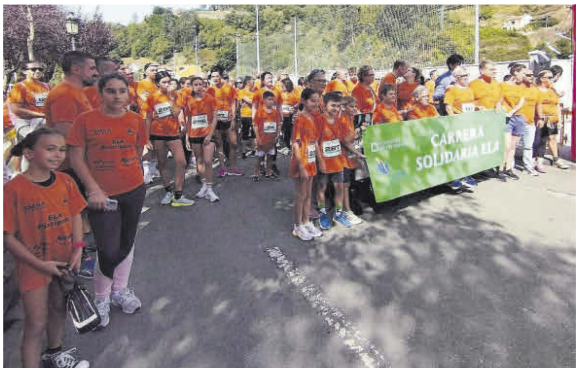
La salida de la carrera, en el parque del Florán.

disciplinares dentro del sistema sanitario público, con las últimas terapias para estas patologías y con el apoyo a la investigación».