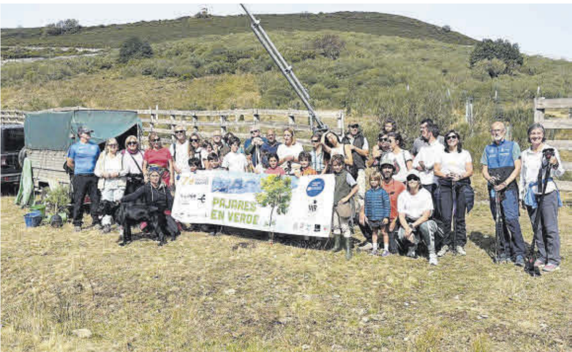
Parte de los participantes en la jornada «Pajares en verde»