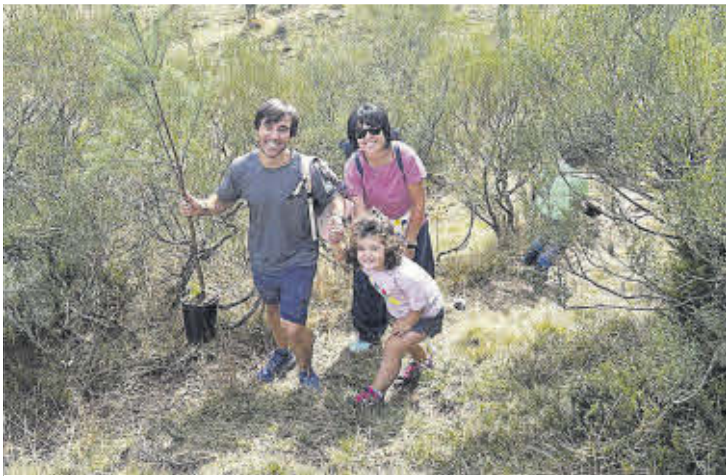
Una familia con uno de los árboles que se plantaron.