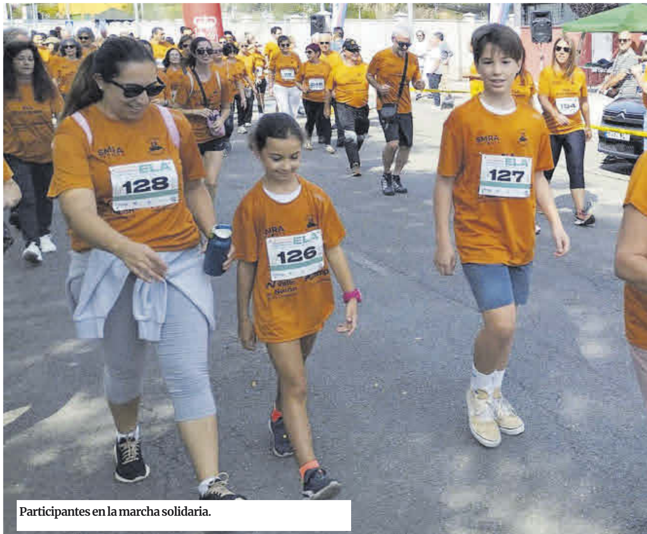
Participantes en la marcha solidaria.

También indicó que, en cuanto «se resuelva esta convocatoria ayudas, vamos a hacer una segunda con el presupuesto restante para aquellas personas que no se presentaron en un primer momento, que han sido diagnosticadas ahora o que ha cambiado su nivel de dependencia. El compromiso sigue también en todo lo que es la atención con equipos multi-