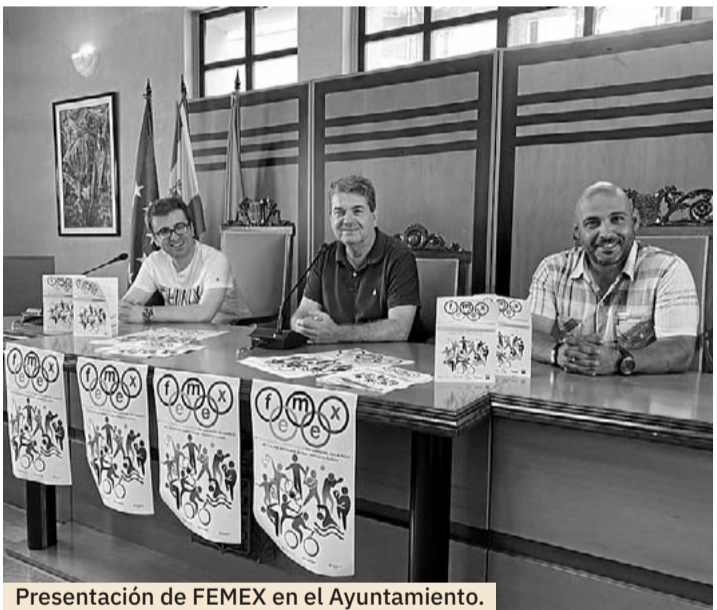
Presentación de FEMEX en el Ayuntamiento.

Galería comercial, artesanía o el certamen ganadero, platos fuertes del fin de semana