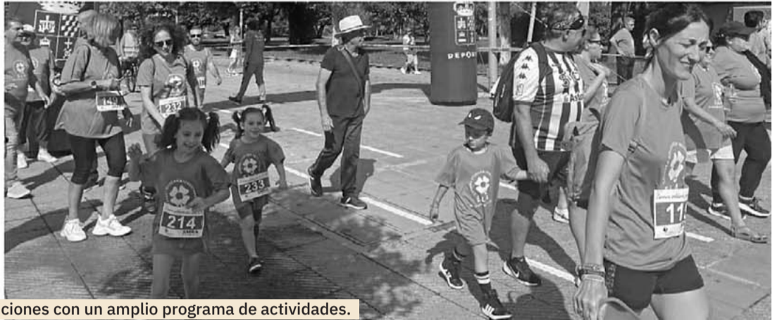
San Martín del Rey Aurelio celebra la 32 FERIA de Muestras y Exposiciones con un amplio programa de actividades.